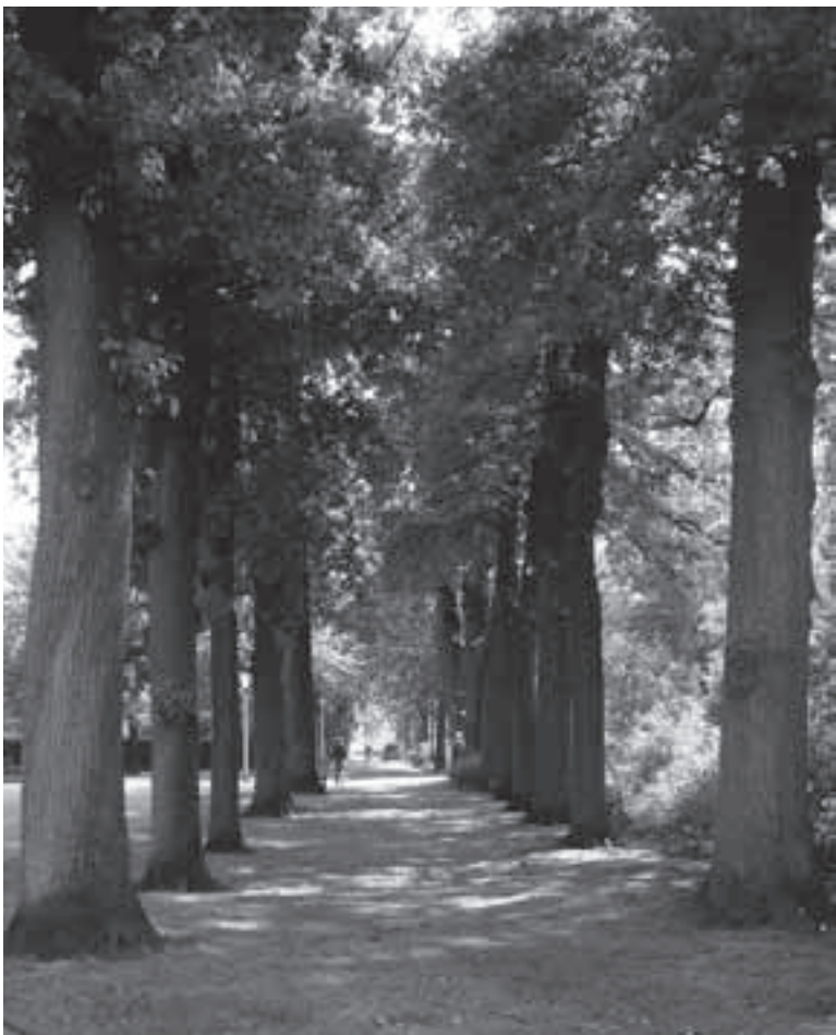
Recente foto het laantje met Zomereiken.