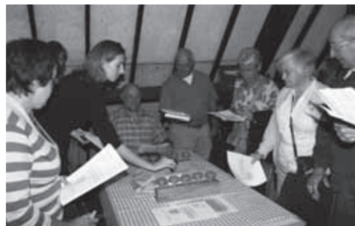
De vrijwilligers van Jan Vissermuseum en Heemkundekring.