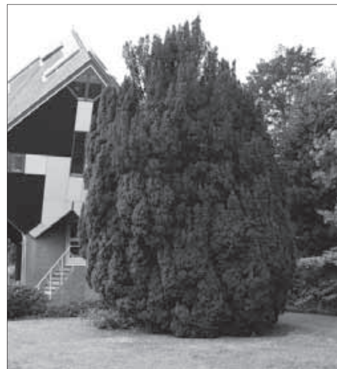
De Ierse Taxus bij de drie paalwoningen.

nu in het plantsoen rondom de drie paalwoningen te vinden zijn. De villa deed voor de oorlog dienst als kazerne van de politietroepen van Helmond en na de oorlog als regionaal kantoor van de Heidemij en ook als Gewestelijk Arbeidsbureau. De villa brandde op 11 maart 1973 volledig af en de restanten werden gesloopt bij de aanleg van de Europaweg.