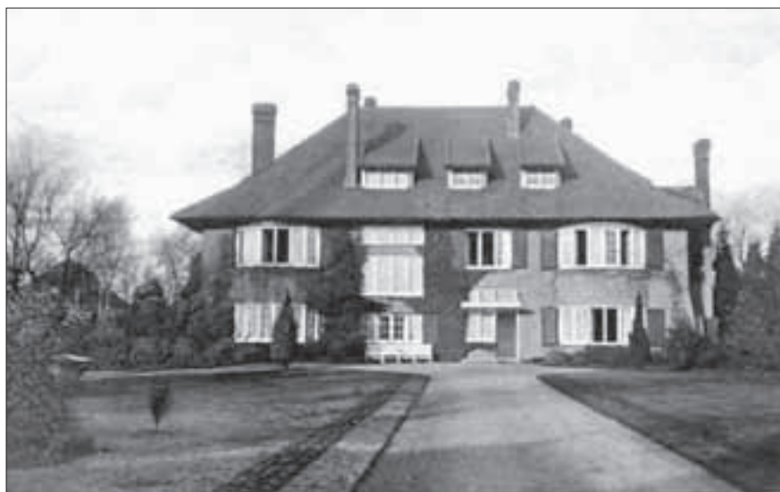
Villa 'De Vuurdoorn' (± 1925) waar nu de drie paalwoningen en appartementen staan.

begonnen daar met lesgeven. In de loop van de tijd groeide de oorspronkelijke pastorie uit tot een kloostercomplex waarin een school, weeshuis, bejaardentehuis en ziekenhuis waren gevestigd. In 1879 werd de kapel met