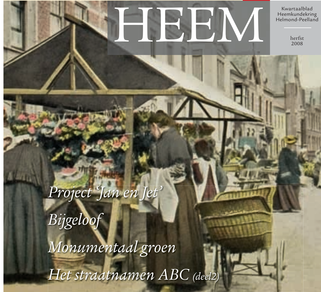
Project 'Jan en Jet' Bijgeloof Monumentaal groen Het straatnamen ABC (deel2)