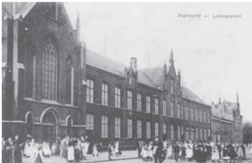
Ansichtkaart van het Liefdesgesticht (±1915) vanaf de Markt gezien.

was in 1832 in Tilburg opgericht met als doel het geven van katholiek onderwijs aan meisjes. In 1838 vestigde de orde zich ook in Helmond en trokken de eerste zusters in een oude pastorie aan de Binderstraat in Helmond en