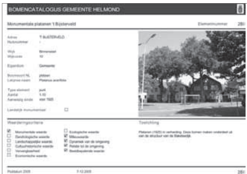
Voorbeeldpagina van de Bomencatalogus zoals die op internet te vinden is.