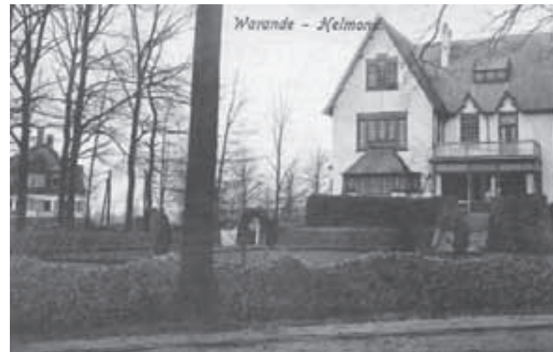
Ansichtkaart van villa Eikenhorst rond 1925 met links het laantje met Zomereiken.

Aan de Warandelaan stond tot in de zeventiger jaren de 'Dikkeboom',