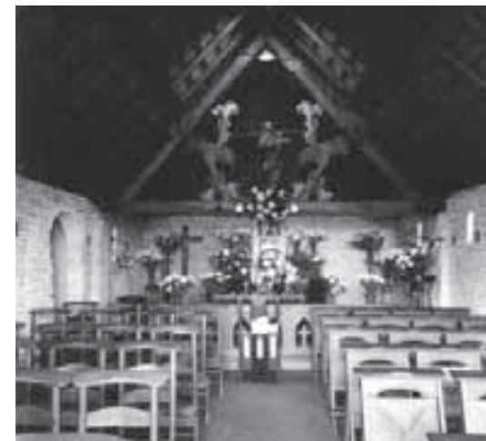
Interieur van de kapel van Binderen.