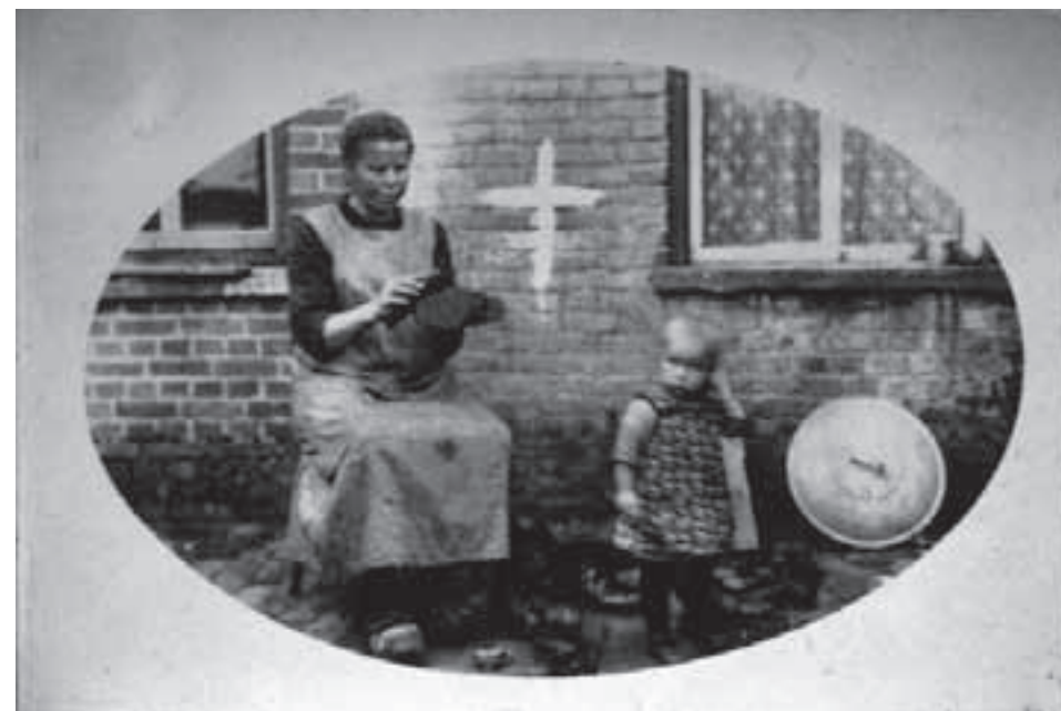
Een kruis geschilderd op de buitenmuur van een boerderij in Vlierden. Foto uit 1928.

Gelukkig heeft vrijdag en kamer 13 en vooral het personeel van het ziekenhuis mij beterschap bezorgd en nieuwe energie om verder te gaan.