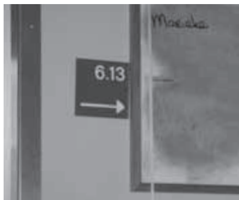
Het Catharina ziekenhuis, kamer 13

Een kruis getekend op de buitenmuur van een huis verdreef de boze